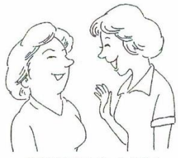
皮膚が持ち上がったよう!

あらためて、自分の顔をじっ くり観察すると、顔全体の皮膚 がかなりリフトアップして(持