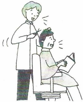
肌荒れ知らず、病氣知らずになった！

私はとりあえず、消毒と軟膏を塗るのだけじゃなく、ツバメの巣ドリンクを、土曜日に二本、日曜日に二本飲みました。